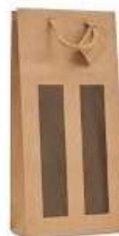
Emballage 2 bouteilles