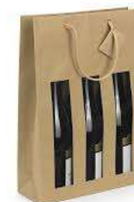
Emballage 3 bouteilles