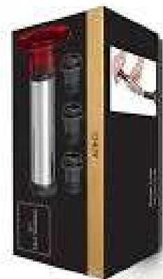
Pompe à Vide + 3 Bouchons - Chef et Sommelier